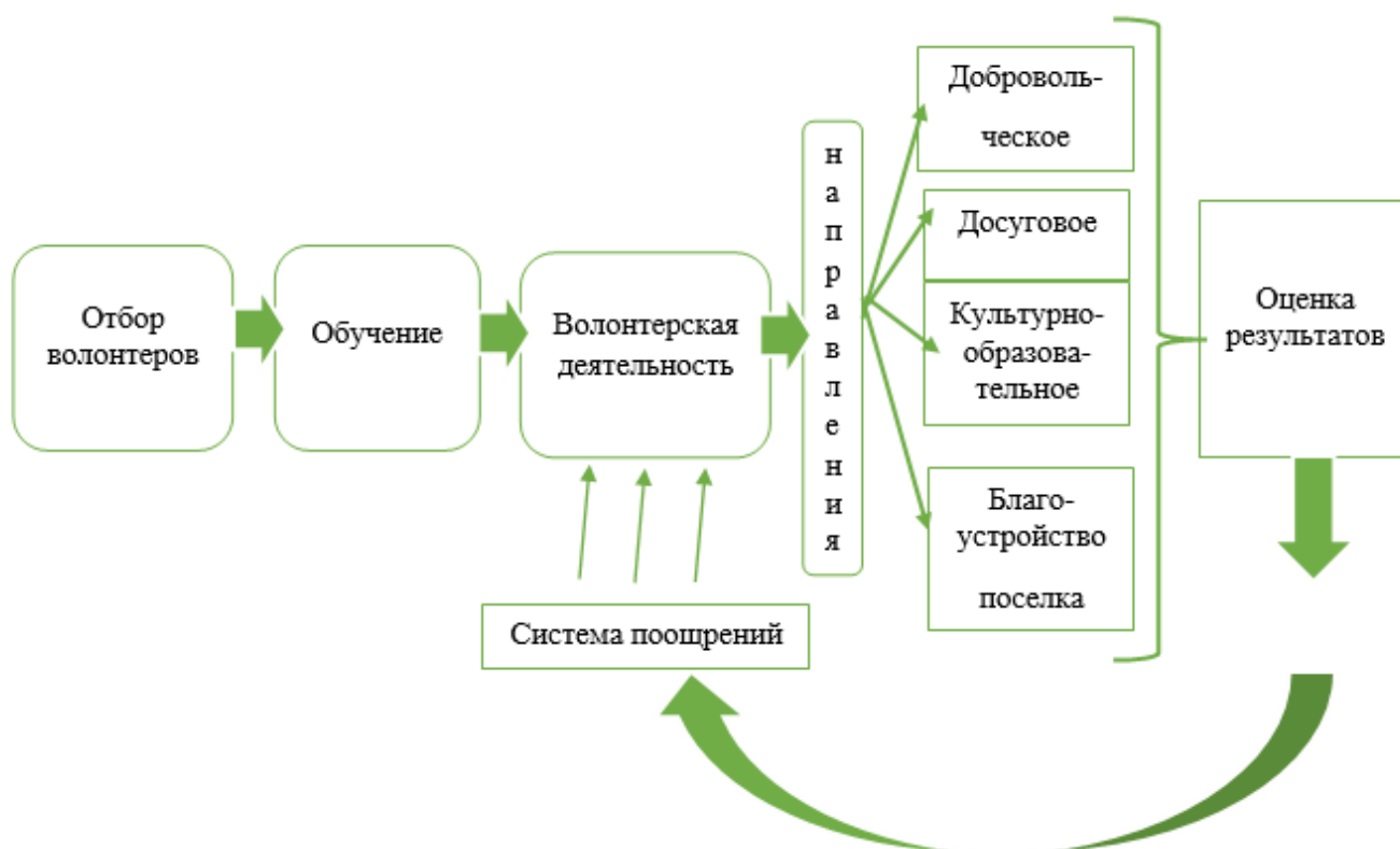
Рис. 1. Механизм реализации волонтерской деятельности в БУ «Березовский районный комплексный центр социального обслуживания населения»

жилого возраста, инвалидам, детям из семей, находящихся в социально опасном положении.